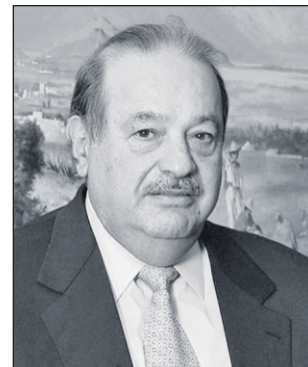
Carlos Slim Helú

El empresario y filántropo mexicano Carlos Slim, quien amasó su fortuna con las telecomunicaciones, llegó a ser considerado por Forbes el hombre más rico del mundo. En 2017 ocupa el sexto lugar del ranking de billionaires con una fortuna de 55.000 millones de dólares. Aparte de ello, una cantidad equivalente al 10% de su patrimonio, unos 5.000 millones, es el músculo financiero y patrimonial con el que opera su red de fundaciones, entre las que destacan Telmex y su fundación epónima, la Carlos Slim (presupuesto anual: 53 M$), matrices ambas de una amplia red de entidades sin ánimo de lucro o proveedoras